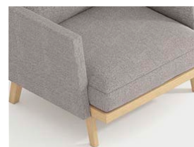
Plataforma de madera